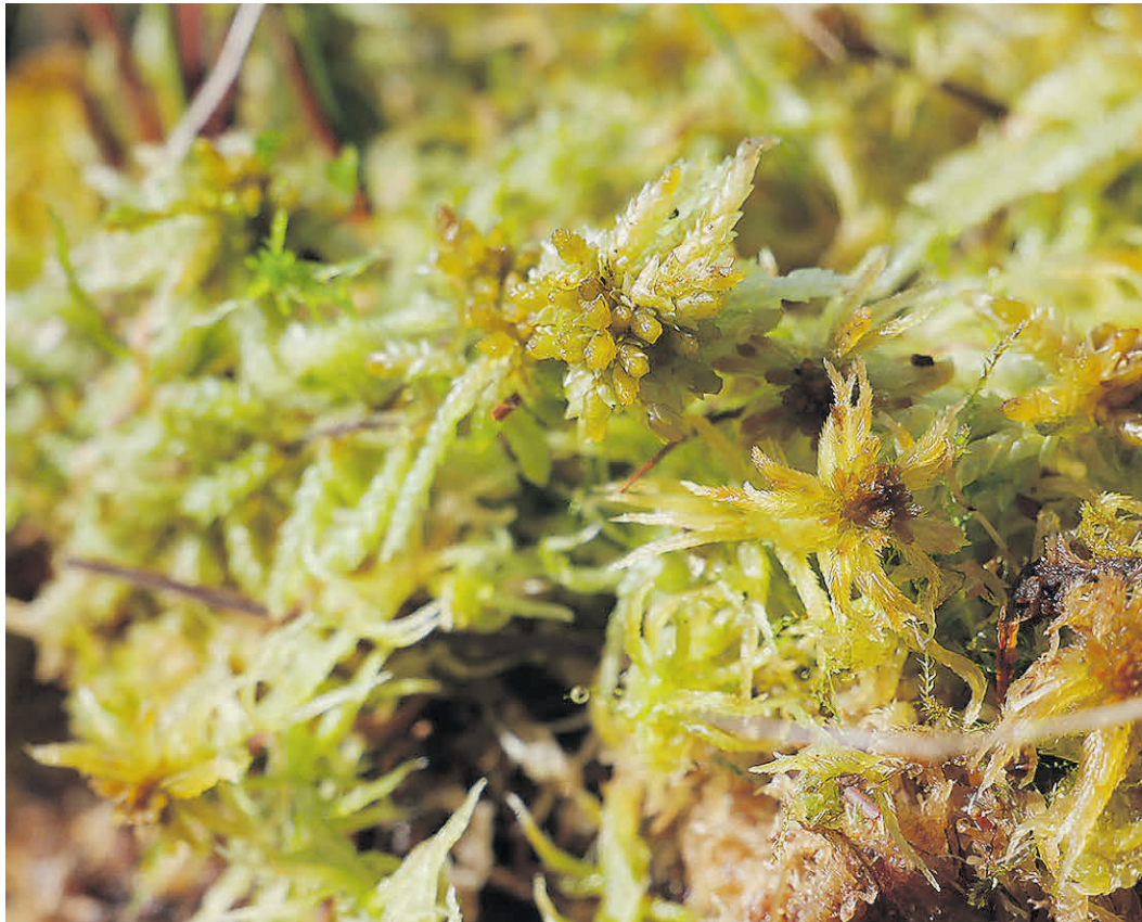
Spielen bei der Wiedervernässung der Moore eine wichtige Rolle: die Torfmoose.

KLIMA BUND Ammerland etabliert neue Veranstaltungsreihe – Perspektiven schaffen